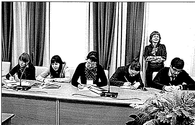
Фото 3. Составляется план проведения мониторинга