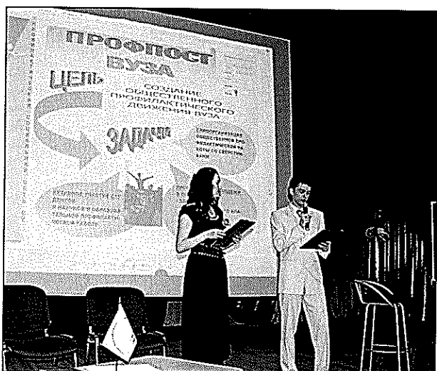
Фото 4. Подготовка к работе студенческого профпоста

– предоставить возможность ознакомиться с положительным и негативным опытом продвижения профилактической работы в виртуальное пространство.