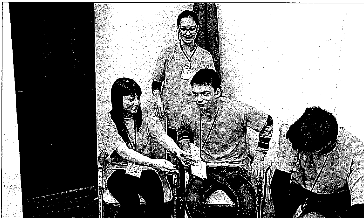
Фото 2. Отработка навыков противостояния социальному давлению

муникативного общения, умениями вести дискуссию на тему профилактики табакокурения, аргументировано отстаивать свою позицию. Именно в контексте тренинга, используя технологию «игрок на поле», можно обучить молодого человека ответственному поведению, здоровому жизненному стилю.