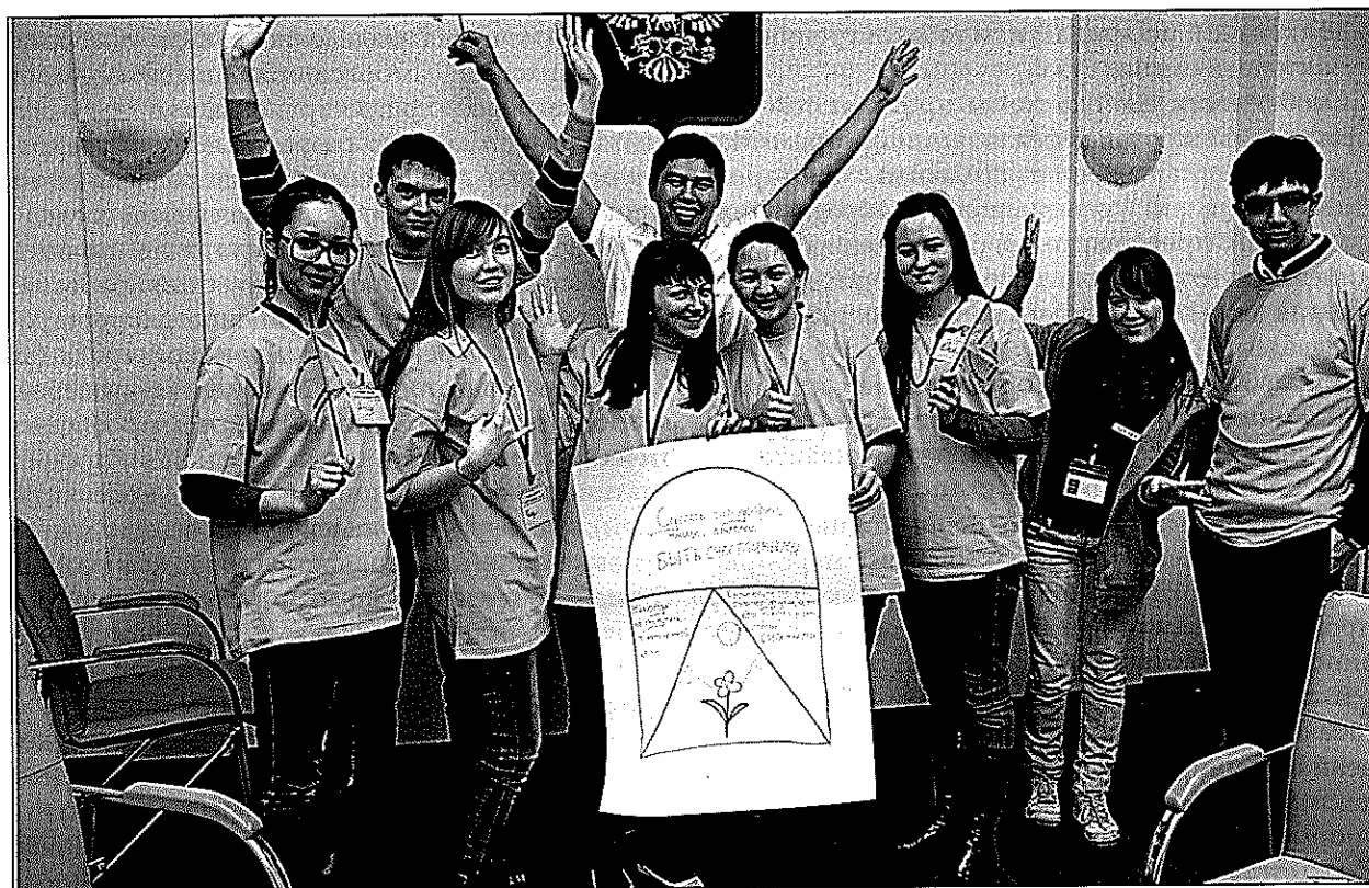
Фото 1. Формирование команды волонтеров

Лидеры должны обладать достаточными знаниями о вреде табакокурения, навыками ком-